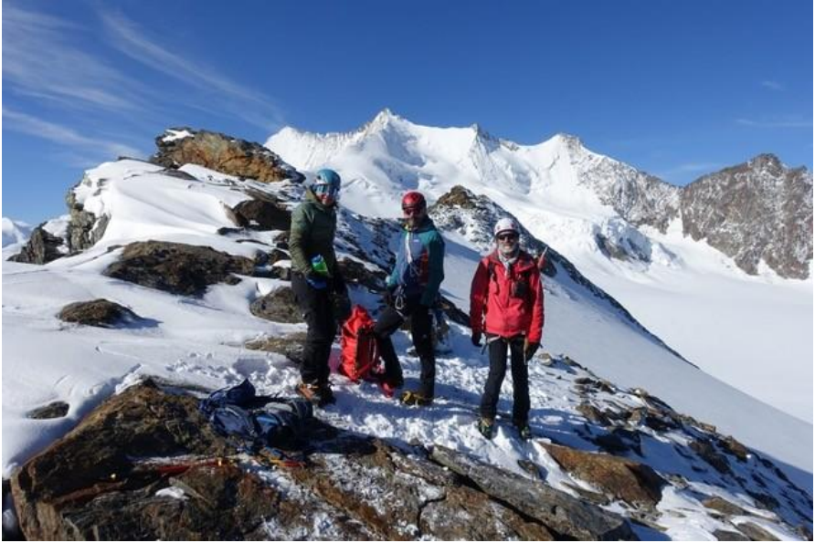
Ausbildungstour - Bild: Andreas Gauerhof